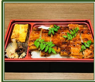
特製タシで仕上げた鰻丼 ¥1,500