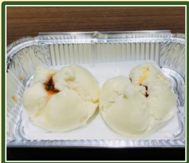
叉焼入りまんじゅう ¥500