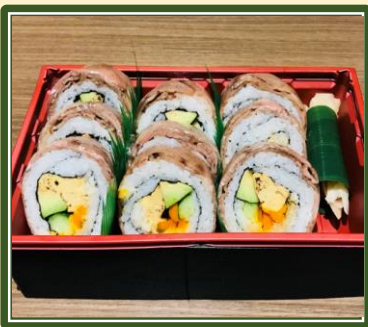
和の料理長山下の肉巻き寿司 (お手軽味噌汁付) ¥2,500