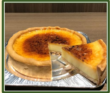
スイーツ「タルアラ」4号12cm ¥1,030