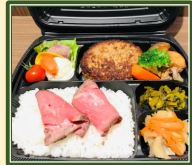
洋の料理長社のローストビーフ&手ごねハンバーグ弁当 ¥2,500