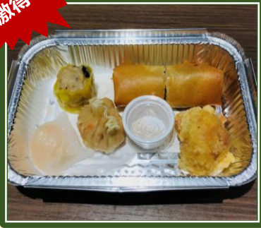
3種の点心&から揚げ ¥500