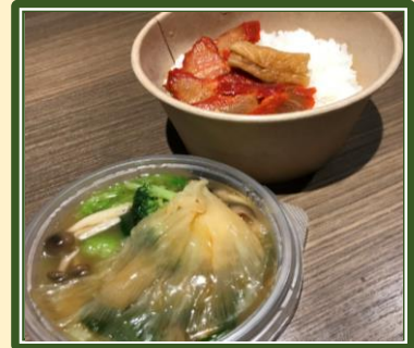
窯焼き叉焼付きツカヒしあんかけ丼 ¥1,500