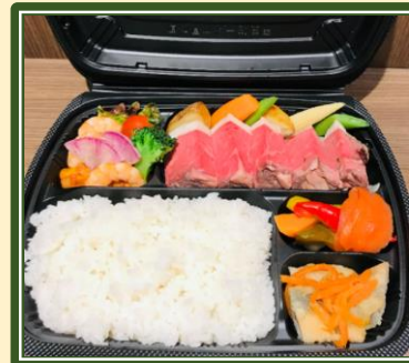
洋の料理長社の牛ステーキ弁当 ¥2,500