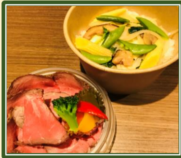
120gのローストビーフ丼 ¥1,500