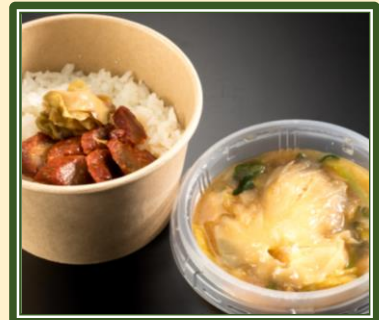
窯焼き叉焼付きワカヒしあんかけ丼 ¥1,500