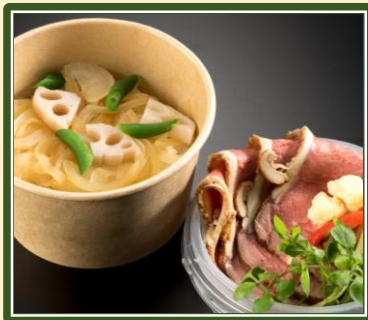
120gのローストビーフ丼 ¥1,500