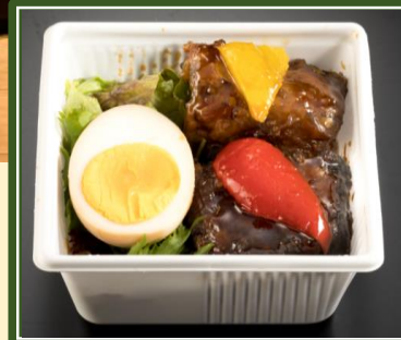
豚三枚肉の黒酢豚 ¥800