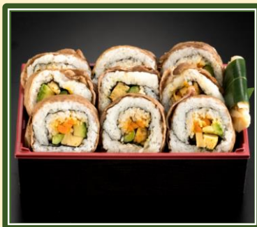
和の料理長澤田の肉巻き寿司 (お手軽味噌汁付) ¥2,500