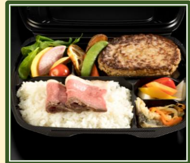
洋の料理長社のローストビーフ& 手ごねハンバーグ弁当 ¥2,500