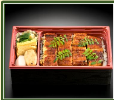
特製タシで仕上げた鰻丼 ¥1,500