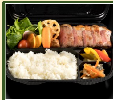
洋の料理長社の牛ステーキ弁当 ¥2,500