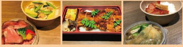
120gのローストビーフ丼 ¥1,500 特製タレで仕上げた鯛丼 ¥1,500 窯焼き叉焼付きフカヒレ あんかけ丼 ¥1,500