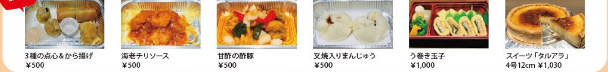
3種の点心&から揚げ ¥500 海老チリソース ¥500 甘酢の豚豚 ¥500 叉焼入りまんじゅう ¥500 う巻き玉子 ¥1,000 スイーツ「タルアラ」 4号12cm ¥1,030