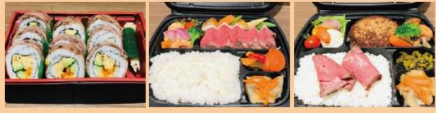
和の料理長山下の内巻き寿司(お手鞆味噌汁付) ¥2,500 洋の料理長辻の牛ステーキ弁当 ¥2,500 洋の料理長辻のローストビーフ&手ごねハンバーグ弁当 ¥2,500

★サイドメニュー: ◎のお料理すべて¥500! ◎ミネストローネスープ(真空パック) ◎健康グリーンサラダ(ドレッシング付き) ◎白ごはん(300g) ◎出汁巻きたまご