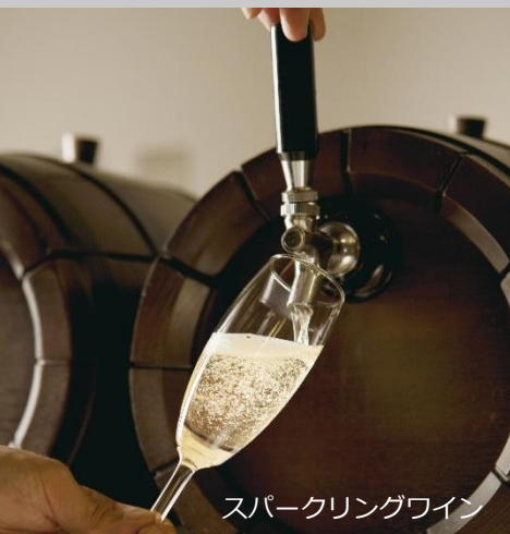
スパークリングワイン