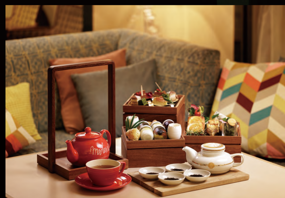
※画像のスイーツは2名様分です

1日1組限定 予約制 2名様～10名様まで 時間 14:00～17:00 (最終入店15:00)