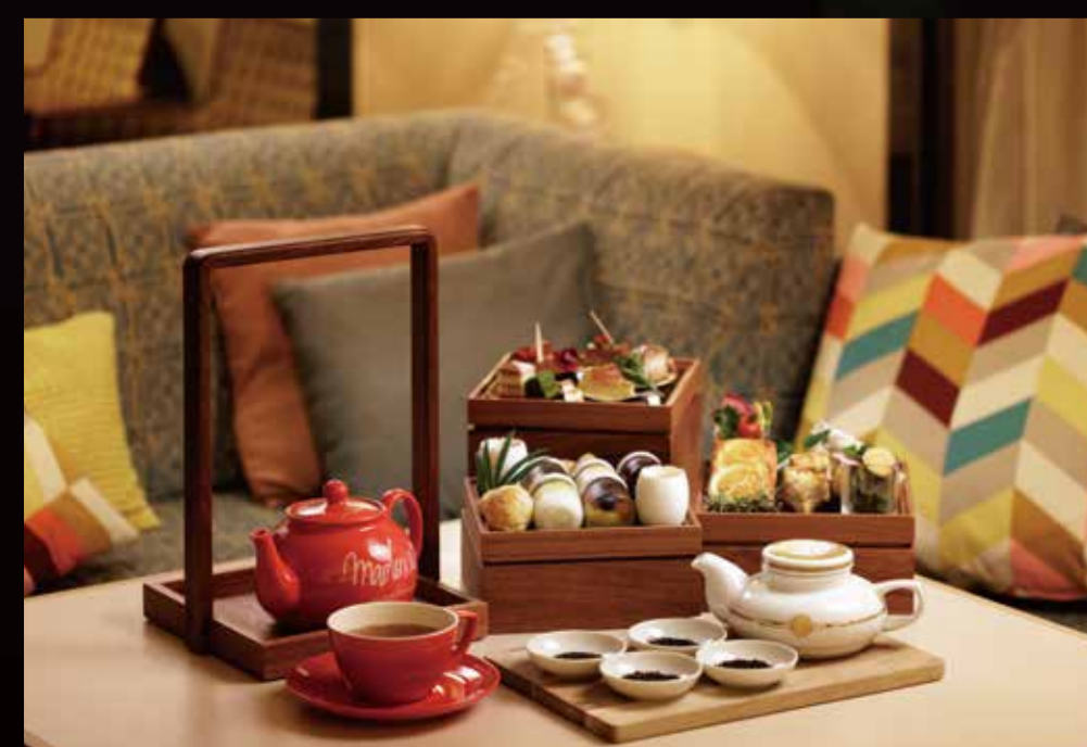
※画像のスイーツは2名様分です